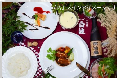
「肉」メインのイメージです