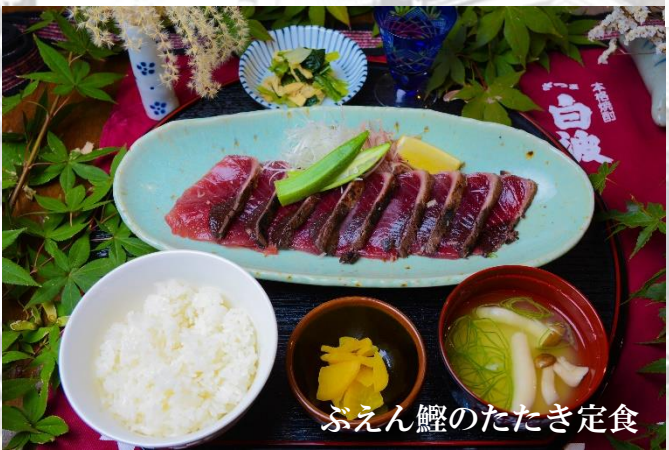
ぶえん鰹のたたき定食