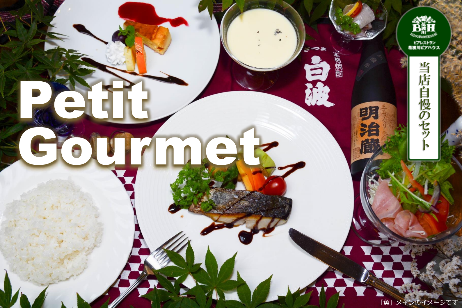
「魚」メインのイメージです