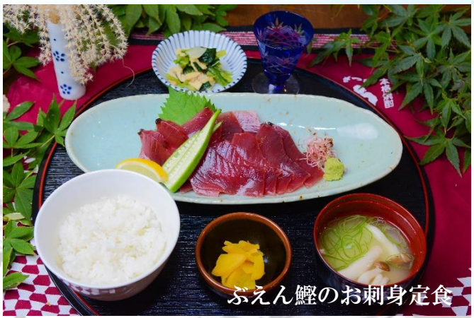
ぶえん鰹のお刺身定食

漁師が釣った鰹を船上で捌き、ごはんのにせ「かつお出汁」をかけて茶漬け風に豪快に食べる漁師めしを現代風アレンジした料理です。花渡川ビアハウスではオリジナルの鰹船人めしをお出ししています。